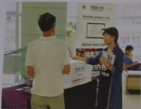
於區苑設置食物回收箱，方便居民捐贈剩食。